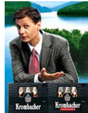
Krombacher-Werber Jauch: Auf den Regenwald anstoßen

Alkoholismus, hat schon Wolfgang Neuss gewitzelt, sei der dritte Weg zwischen Kapitalismus und Sozialismus, offen für jedermann, leicht zu begehen und von schnellem Erfolg gekrönt. Nun, dank Krombacher, Jauch und WWF, wird der bewusste Alkoholkonsum zum Mittel der Entwicklungshilfe und der Nächstenliebe. Schon heute bekommen Täter, die im Rausch Straftaten begehen, in der Regel mildernde Umstände, demnächst werden sie ein Alibi haben, das sie über jeden Verdacht erhebt: "Ich wollte doch nur, dass die Pygmäen Lesen und Schreiben lernen!"